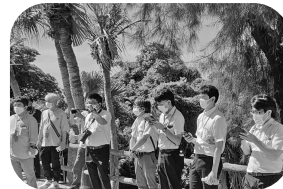
▲説明を聞く参加者

2日間の平和オキナワ集会とピースフィールドワークを通し、今次平和行動テーマである「語り継ぐ戦争の実相と運動の継続で恒久平和を実現しよう」のもと、戦争の悲惨さ、今もなお継続している米軍基地問題に対して沖縄がどのように活動しているか一端を垣間見ることが出来た。平和行動に参加することで悲惨な戦争の歴史を「知り」、「体験」することが出来たので、この経験をもとに戦争が繰り返されないように他の人に伝える役目を担っていく必要があると感じた。