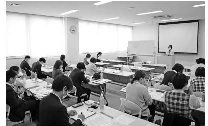
▲光・下松地区会議

参加者のおよそ9割の方が「大変満足」「満足」と答えられており、有意義な研修となったことが伺えました。