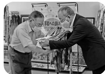
▲カンパ金と千羽鶴を贈呈