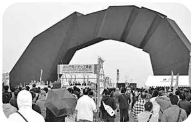
▲平和ノサップ集会

連合は、北方領土返還と日ロ平和条約の締結を通じた平和の構築をめざし、北海道根室市での平和行動として取り組みを続けてきました。本年の「2021平和行動 in 根室」については、現地・根室市での開催を見送り、動画視聴参加によるWEB開催となりました。北方領土問題について知る・学ぶとともに、平和に暮らし、働けることの意義・尊さを私たち全員が改めて心に刻む機会とするため、皆様のご視聴をお願いいたします。