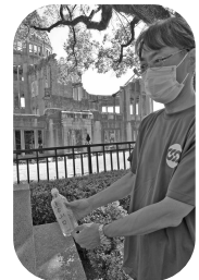
▲広島・長崎では組合員の皆さまから託された折鶴の献納と全国各地で採取された水の献水が行われました。(写真は広島での献納・献水の様子)