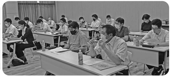
▲政治学習会の様子

きる。労働組合は働く人の声を政治に反映させる大事な役割を持っている。しっかり自分の一票を行使してほしい」と訴えました。