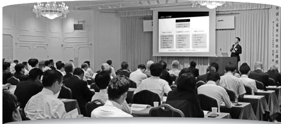
▲2019労使トップセミナー

山口県労使雇用対策協議会は、2020労使トップセミナーを開催します。今年のテーマは「コロナ禍における女性活躍推進」を予定しています。連合山口も協議会の構成員であることから、各単組代表者、雇用担当者の皆様の積極的なご参加をお願いいたします。