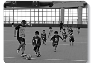
レノファサッカー教室