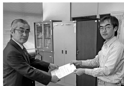
▲長門地区会議 対市要請