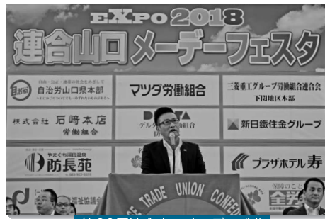
第89回連合山口メーデー式典

連合山口は、4月28日(土)山口きらら博記念公園において「EXPO2018連合山口メーデーフェスタ」を開催し、約30,000人が参加した。