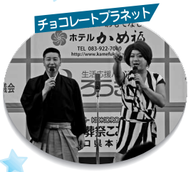
チョコレートプラネット