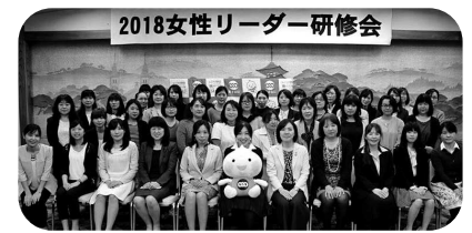
▲2018女性リーダー研修会

からは「女性の声をあげられるのは、女性が望ましい」、そしてこちら「男性にも聞いてほしい講演」など、ご意見いただきました。女性委員会は、今後もご協力いただいたアンケートを参考に、多くの働く女性に参加していただける活動に取り組んでいきます。